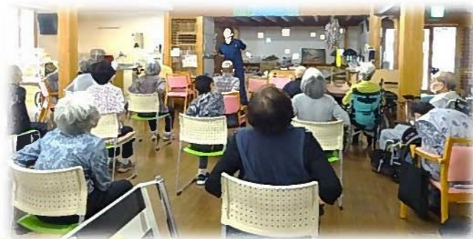
リハビリスタッフの指導によるリハビリ体操