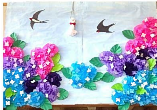
6月の壁画 「梅雨の頃」