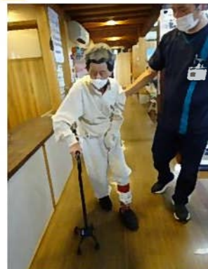
歩行訓練 頑張ってます★★