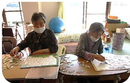
パズルで頭の体操