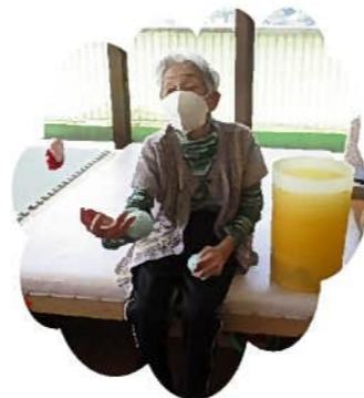
お手玉「昔は良くしてたけどな～」